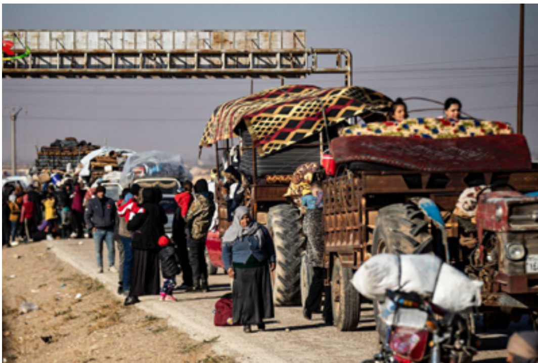
Caravana de refugiados que huyen de Shahba hacia la región de DAANES, 4 de diciembre 2024