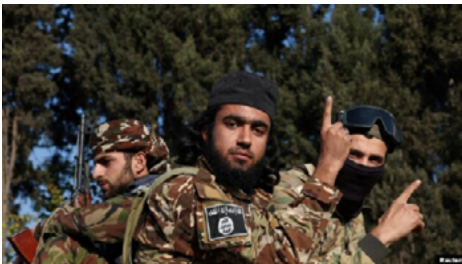
Combatientes rebeldes montan en un vehículo tras tomar Damasco y derrocar al presidente Bashar en Siria, 9 de diciembre de 2024.

A pesar de su imagen pública moderada, utilizada estratégicamente para recabar apoyo internacional, el HTS sigue compartiendo muchas de las ideologías radicales de Al Qaeda y ha seguido recibiendo apoyo de actores extranjeros, entre ellos Turquía, aunque también ha protagonizado violentos enfrentamientos con otros grupos de la oposición. Varios informes siguen poniendo de relieve su implicación en abusos contra los derechos humanos, y su alineación con otros grupos yihadistas ha seguido siendo motivo de preocupación para las potencias regionales y mundiales, como podemos ver en las imágenes de las redes sociales de la región y en los informes locales de las organizaciones políticas y humanitarias sobre el terreno.